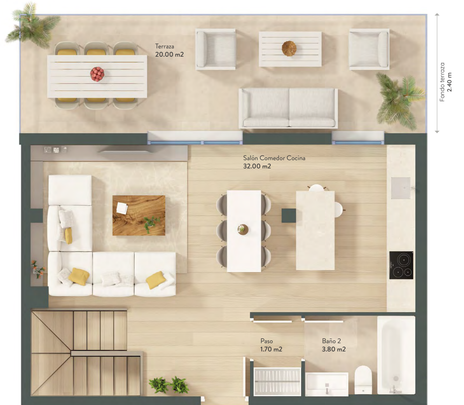
Plantas Primera y Segunda