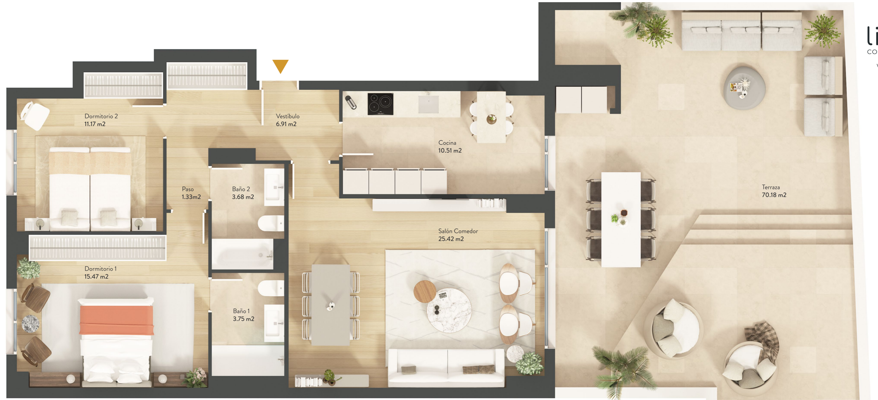
Portal 2 Portal 1